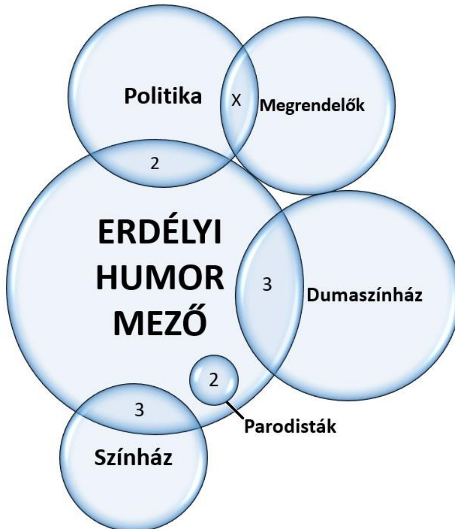
Ábra 1. Az erdélyi humor mező

Az erdélyi humorban a szabályrendszer olyan alapvetőségekre épít amely valószínűleg a Stand Up Comedy műfajában mindenhol örökérvényű. Az első és legfontosabb a szerzői jogokra vonatkozó szabályok. A plágiumot a mezőn belül a csoport valamennyi tagja nem nézi jó szemmel, az megtörténhet, hogy „urban legend”-et mesélünk és volt rá precedens, elsősorban elkerülendő, de bocsánatos bűnként kezelendő. Viszont a legnagyobb szankciót az jelenti amikor tudatosan akár más erdélyi fellépő poénjával történik a visszalépés. Kiközösítés történik sőt, gyakran előfordul, hogy amennyiben az egyik fellépő foglalt, a megkeresett egy másikat ajánl maga helyett, viszont egy „büntetett előéletű humorista” nem fog fellépési lehetőséget kapni. Ez olyan eltiltással is járhat, hogy többé nem hívják meg a