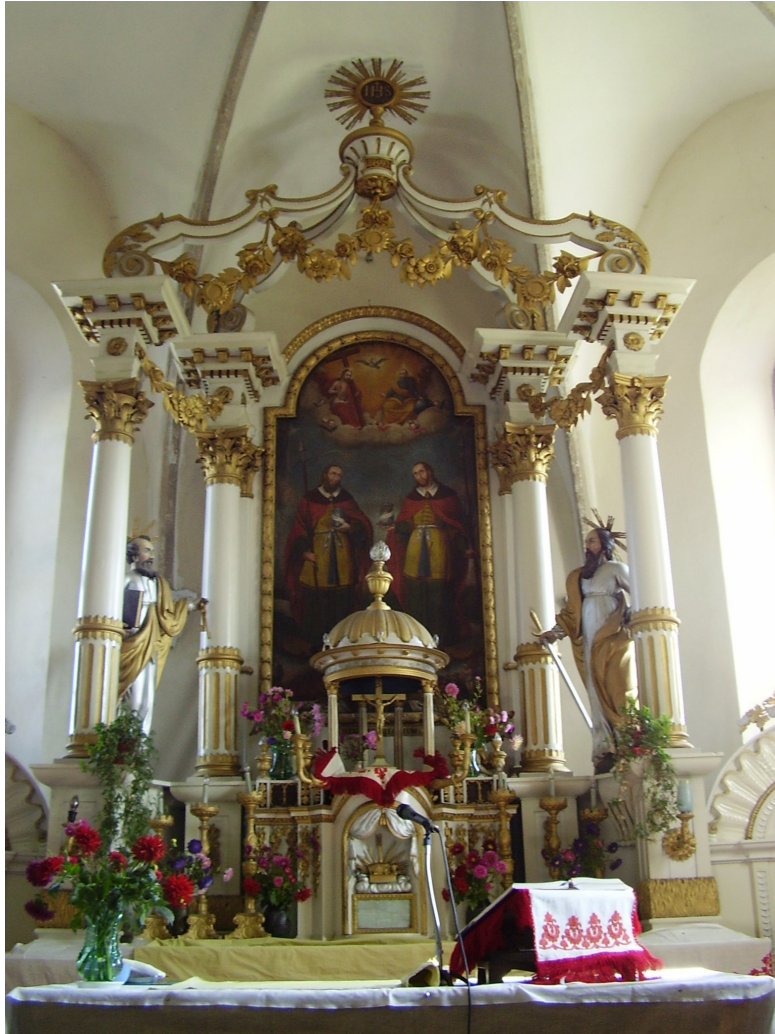
5. A csíkkozmasi templom főoltára