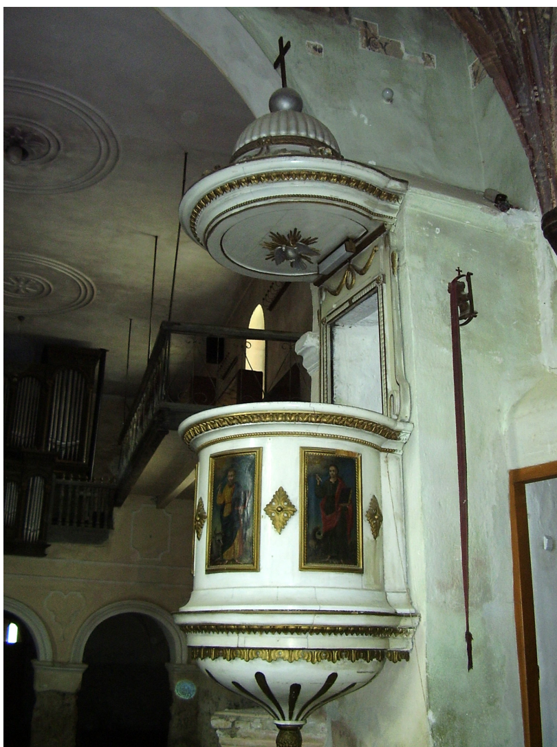
20. A csíkmenasági templom szószéke