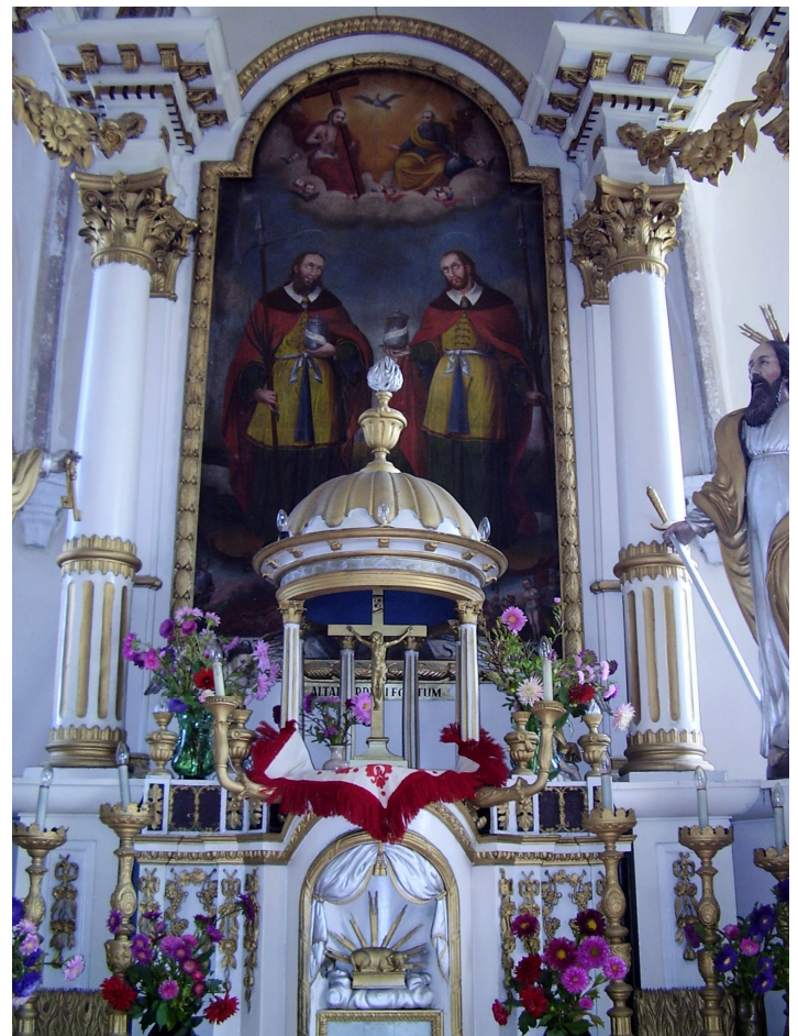
6. Oltárkép és tabernákulum.