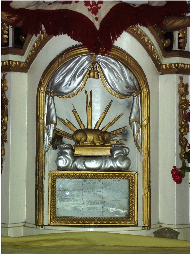
7. A csíkkozmasi főoltár tabernákulumának ajtója