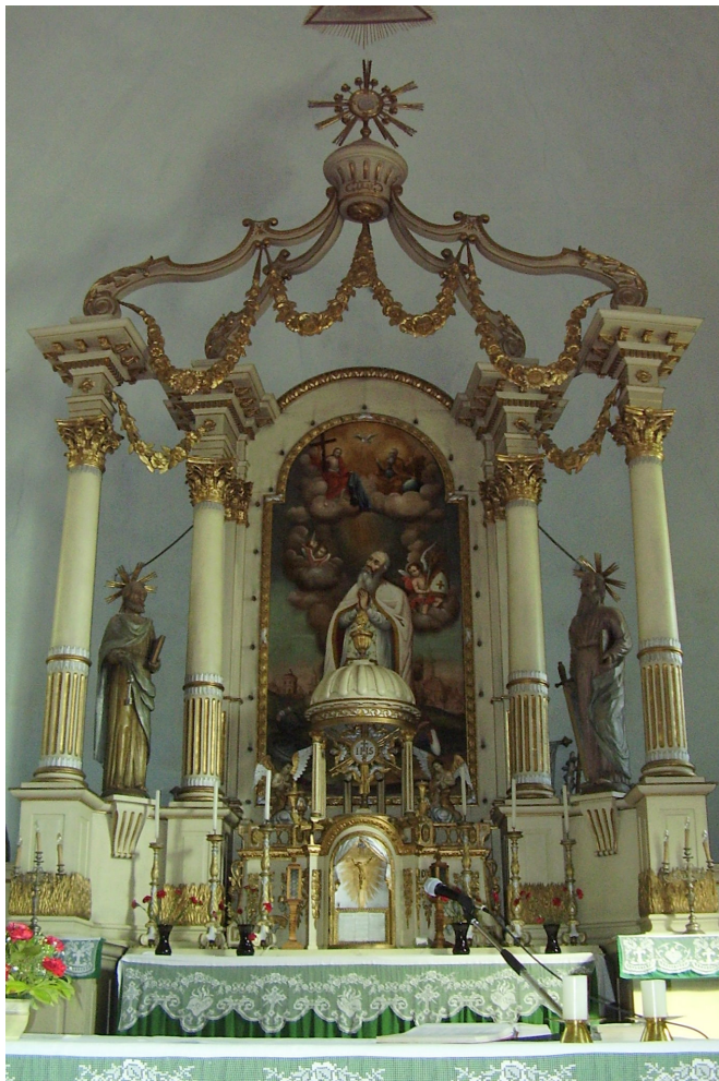
1. A csíkszentmártoni templom főoltára