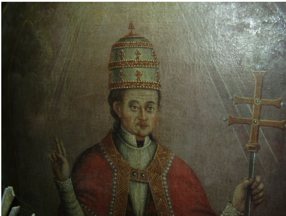
19. A mellékoltár festménye. Szent Gergely pápa