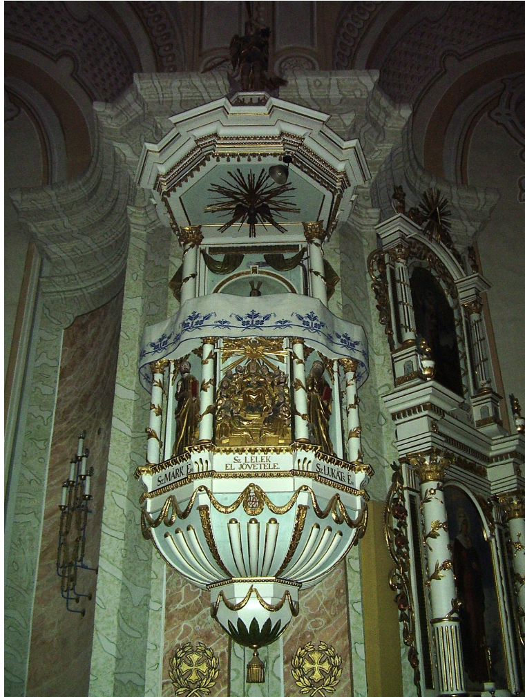
15. Szószék. Csíksomlyó