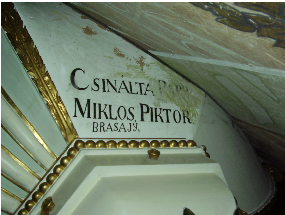
16. Felirat a szószékkosár alján