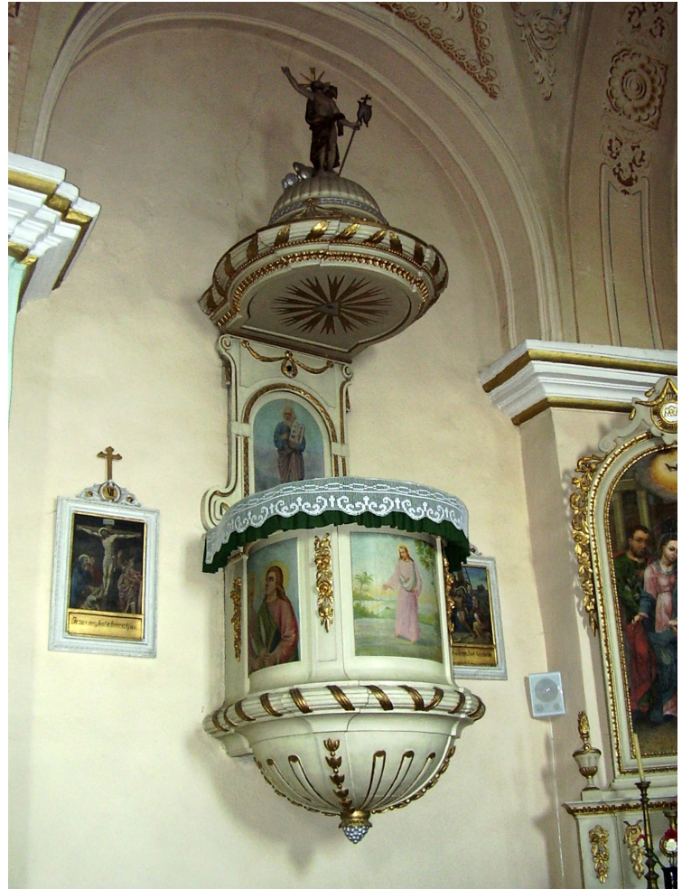
4. A csíkszentmártoni szószék