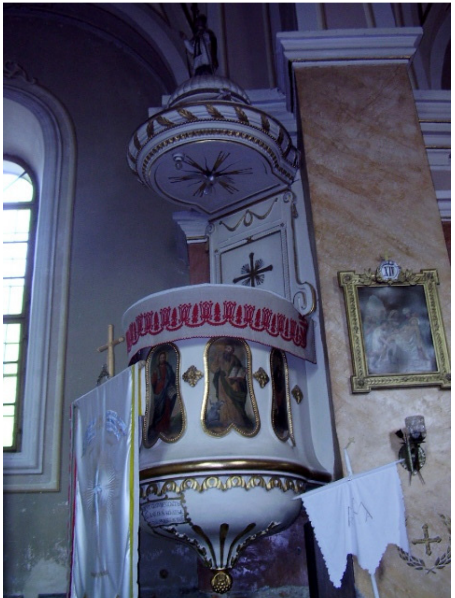
12. A tusnádi templom szószéke