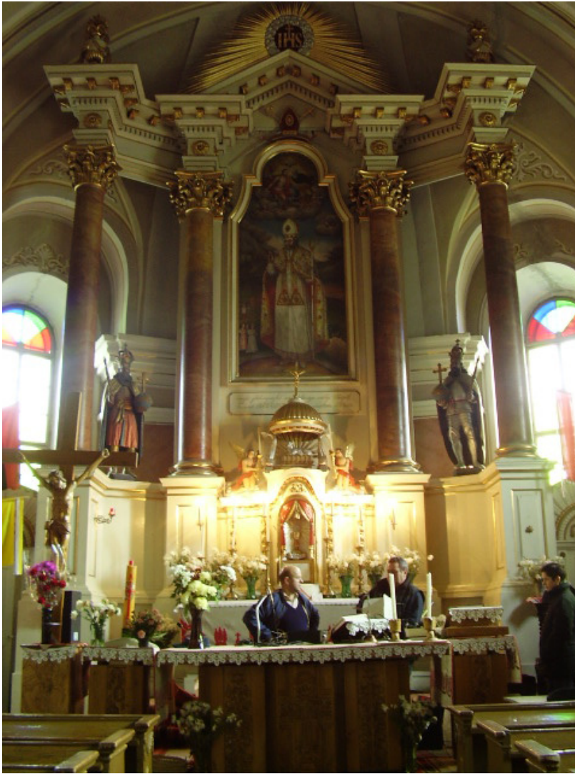
9. A tusnádi főoltár