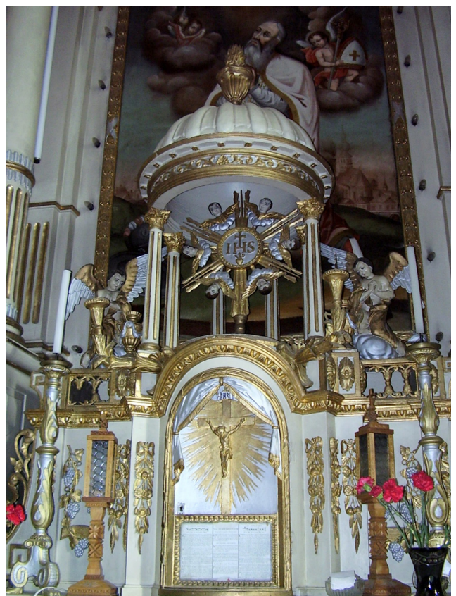
2. A csíkszentmártoni főoltár kupolás tabernákulum-építménye