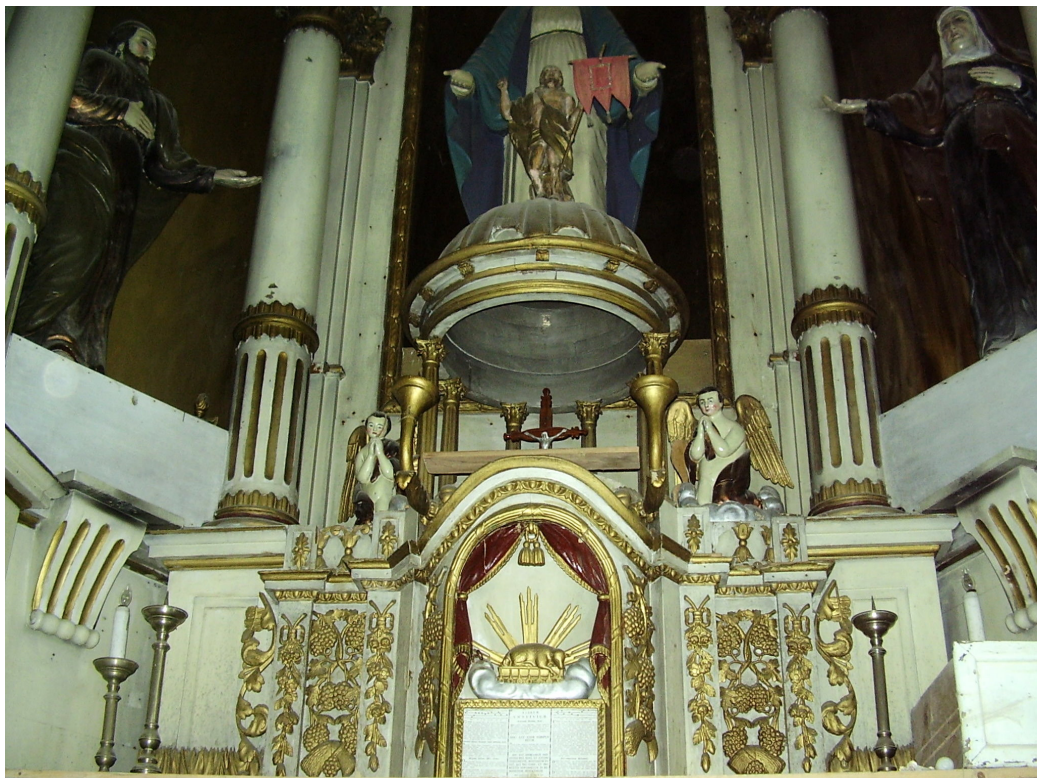
18. Tabernákulum. Csíkmenaság