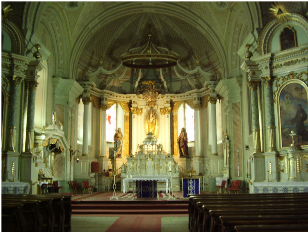
13. A csíksomlyói templom főoltára