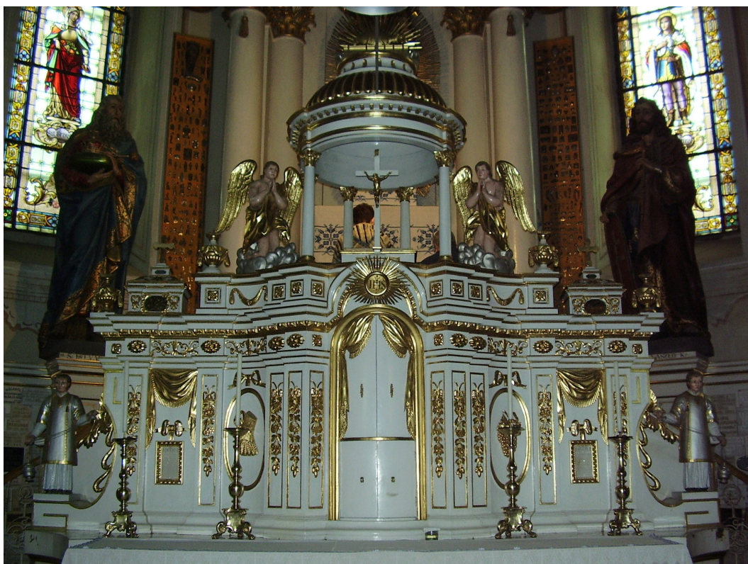
14. Tabernákulum-építmény. Csíksomlyó.