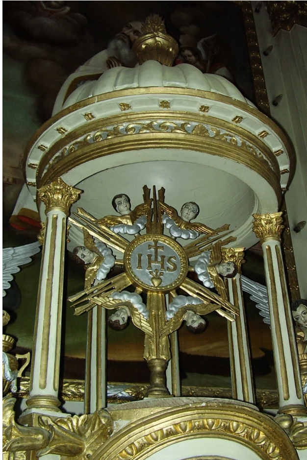
3. A csíkszentmártoni főoltár tabernákulumának kupolája