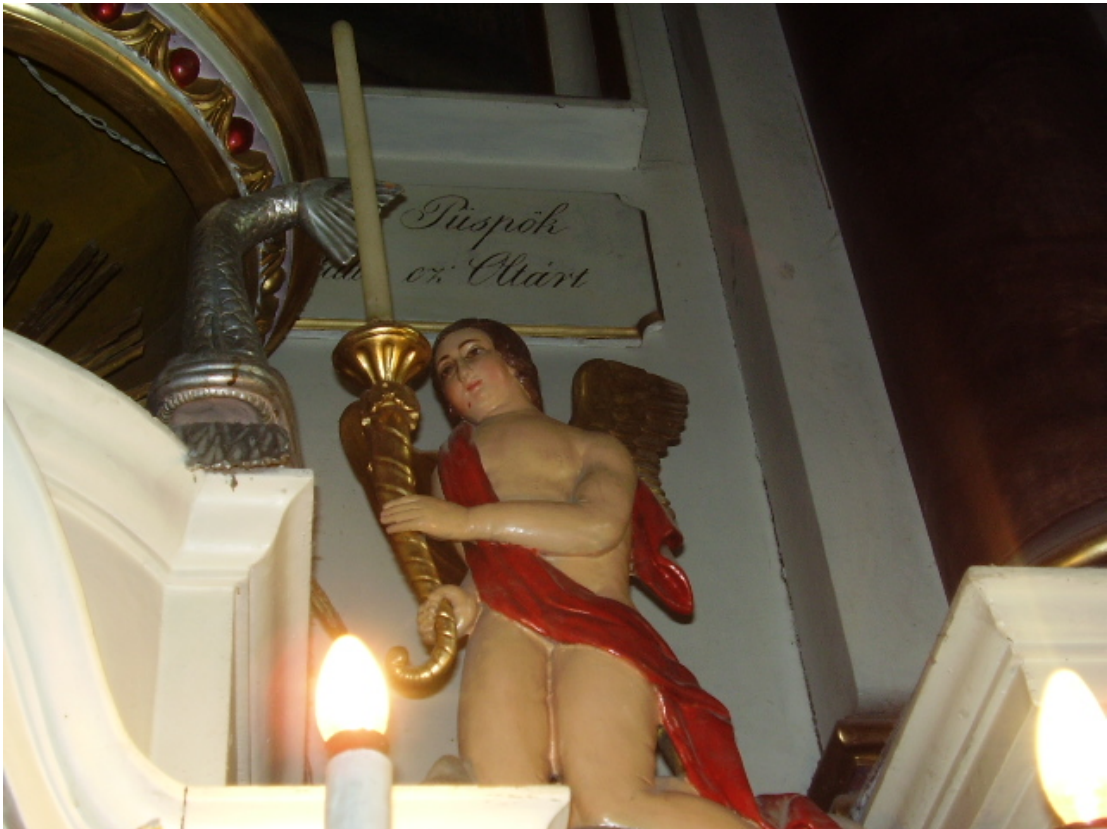
11. Angyal. Tusnádi főoltár