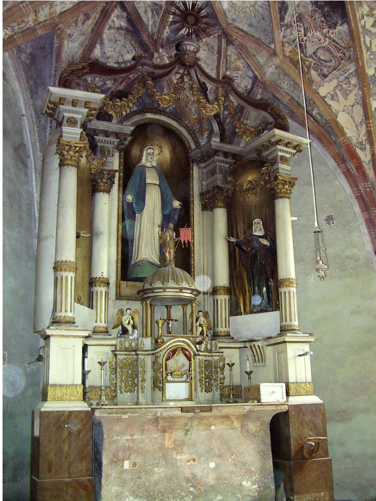
17. A csíkmenasági templom főoltára