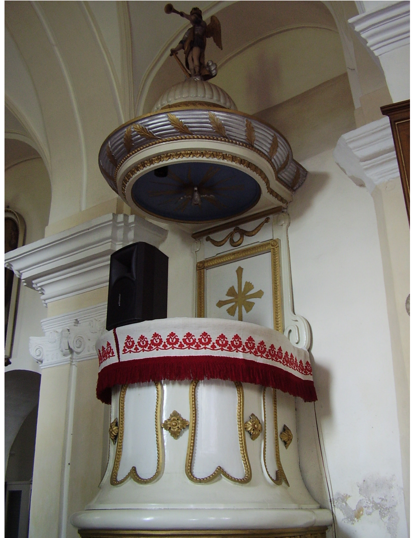
8. A csíkkozmasi templom szószéke