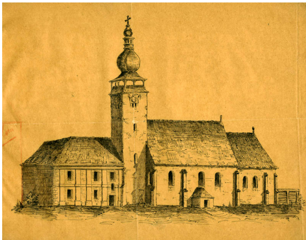
2. Meinig Artúr rajza a Mindenszentek templomról és a piarista rendház délnyugati sarkáról