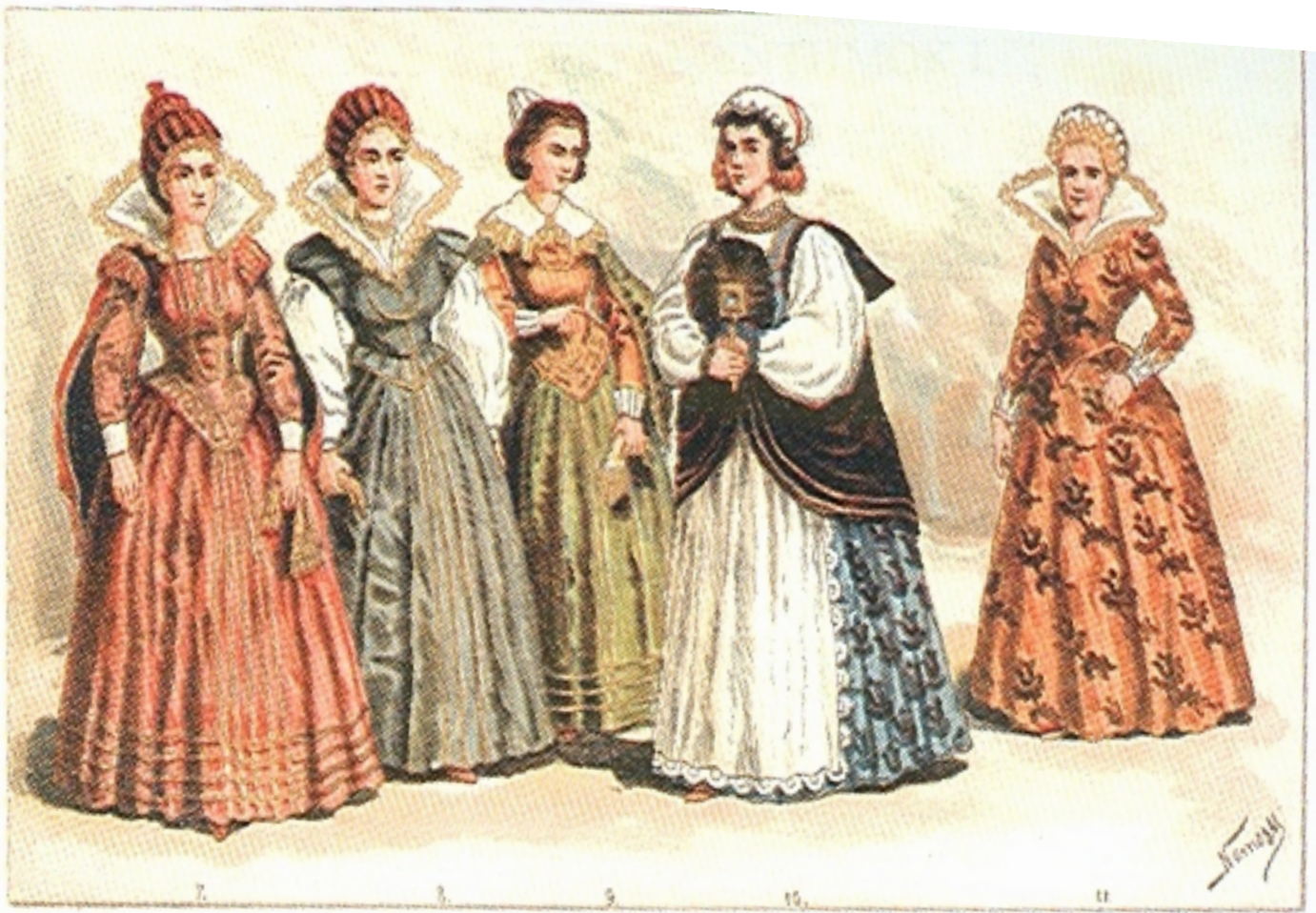
Erdélyi nemesi viseletek a 17. század második feléből