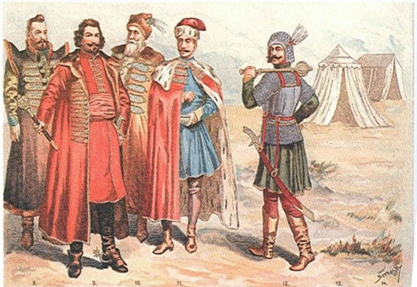
Erdélyi nemesi viseletek a 17. századból