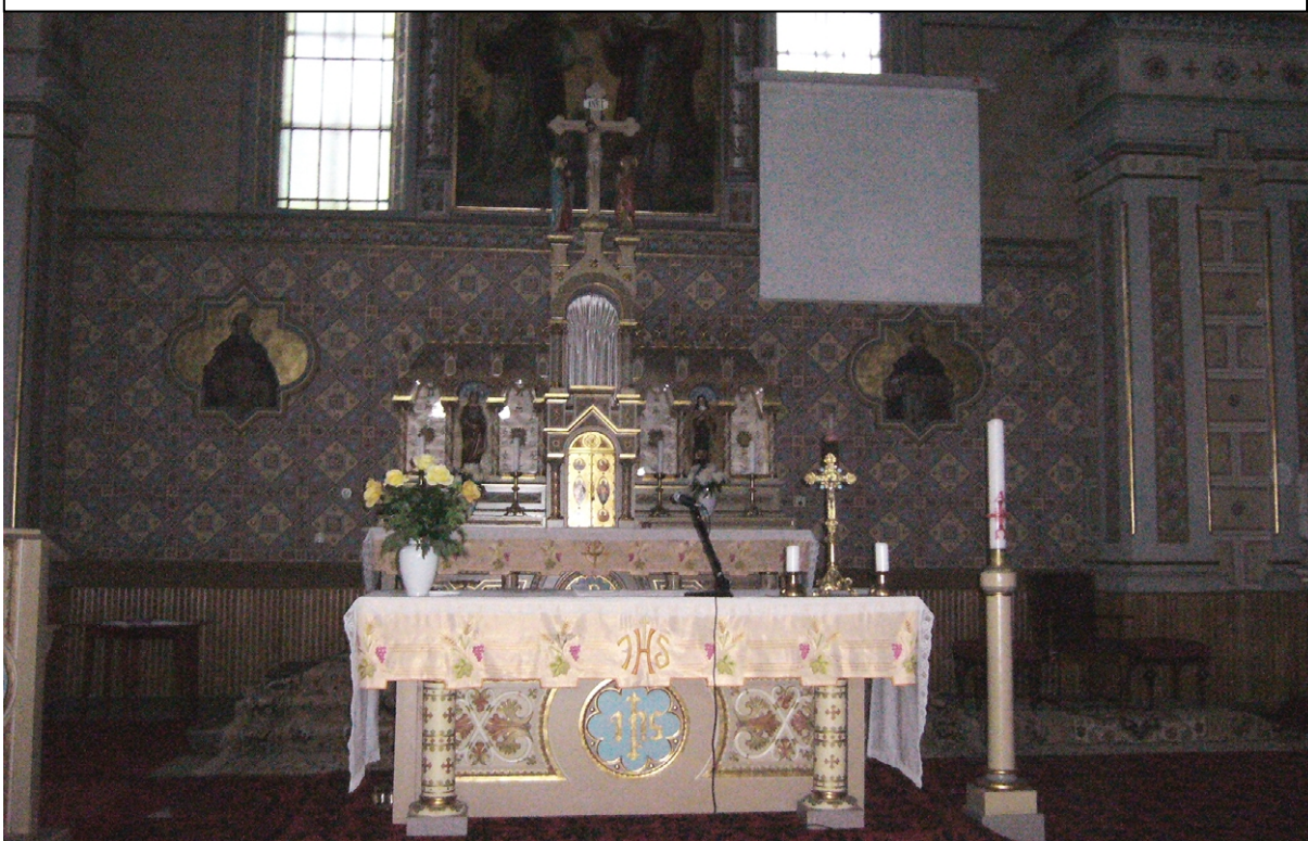
A Szent János aposzol és evangélista templom oltára