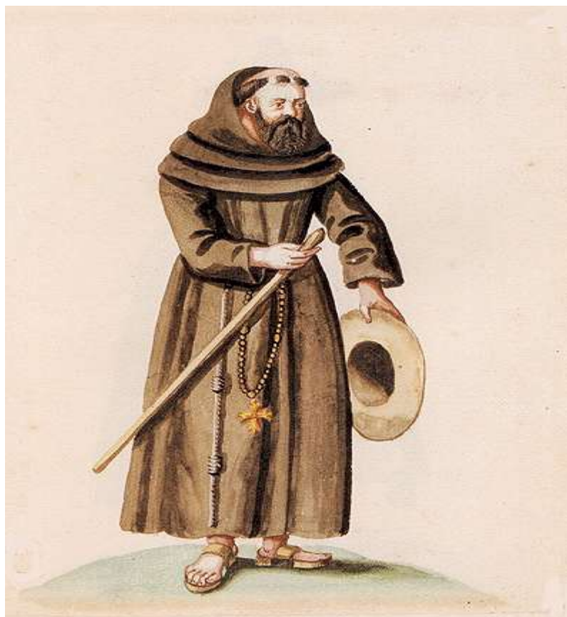
A Franciscan Monk