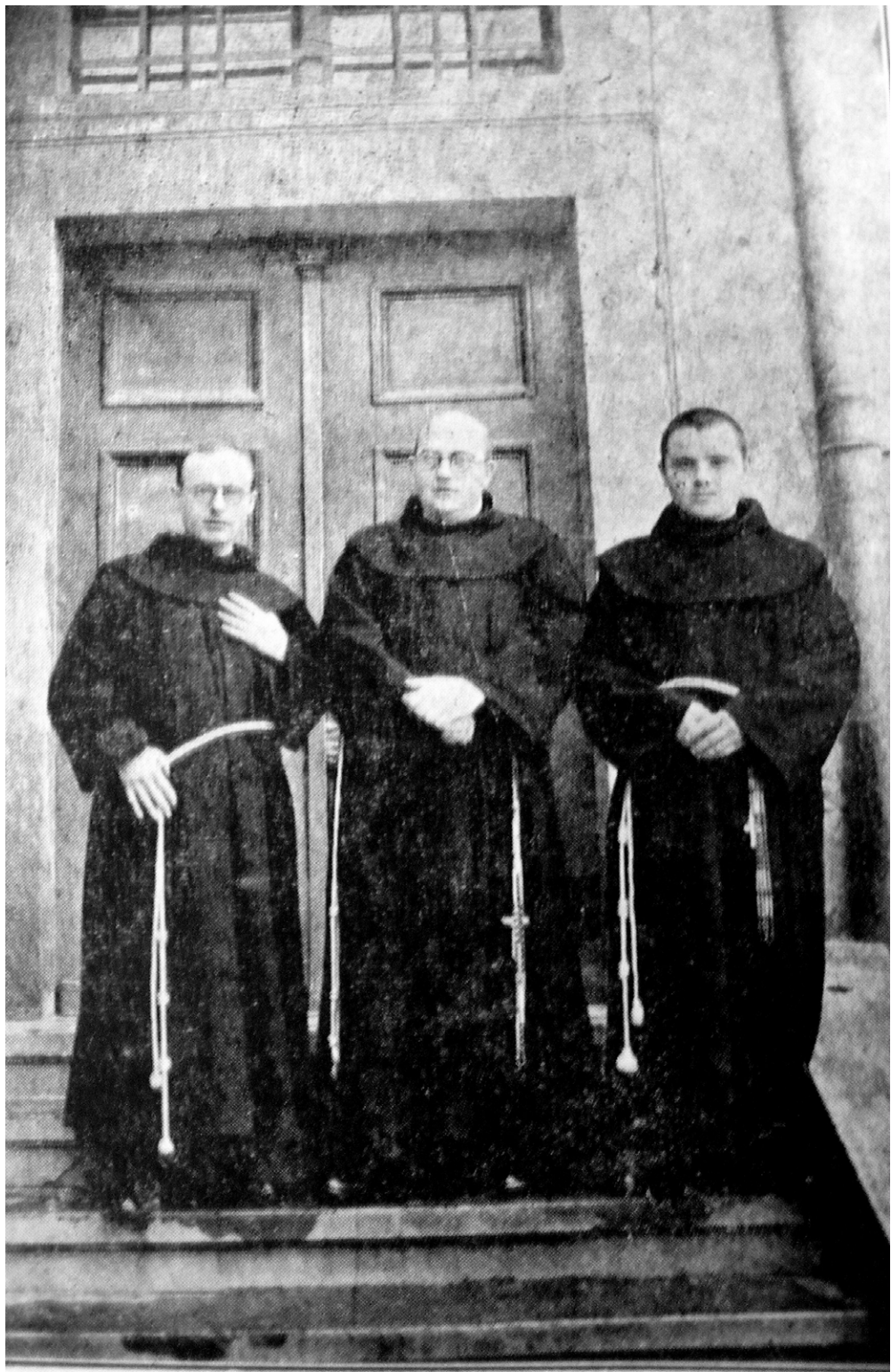
A szatmári rendház tagjai.