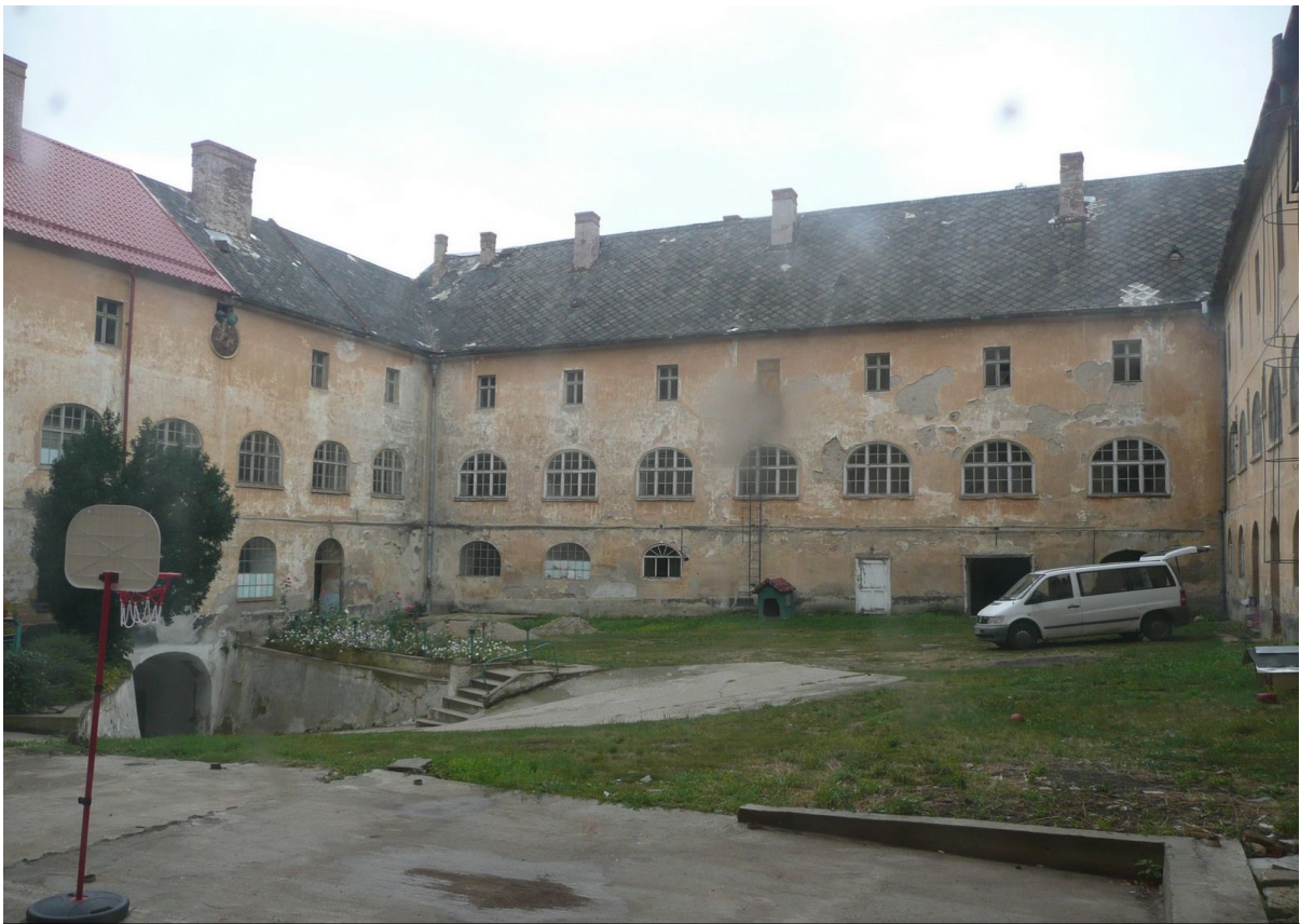
A márairadnai kolostor