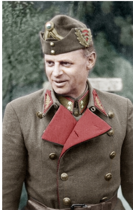
Vitéz Kisbarnaki Farkas Ferenc