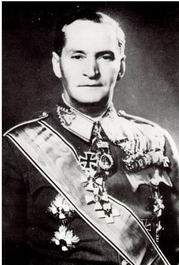
Vitéz Dálnoki Miklós Béla