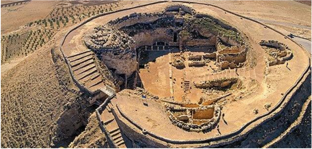
5. melléklet – Herodium maradványai