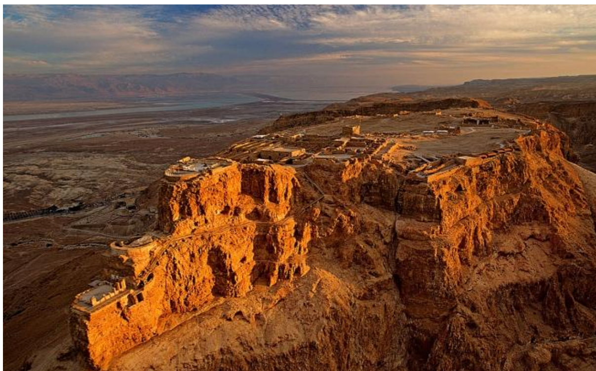
4. melléklet – Massada