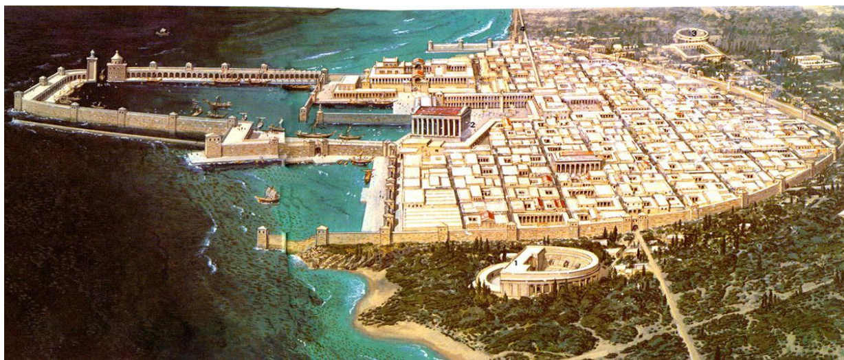
3. melléklet – Caesarea Maritima rekonstrukciója